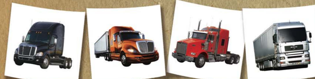
VEHÍCULOS DE CARGA MÁS EXPORTADOS