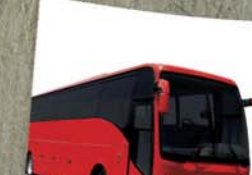
VEHÍCULOS DE PASAJE MÁS EXPORTADOS